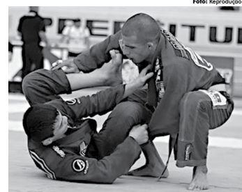
O jiu-jitsu é um esporte de muita técnica que visa diminuir o oponente.