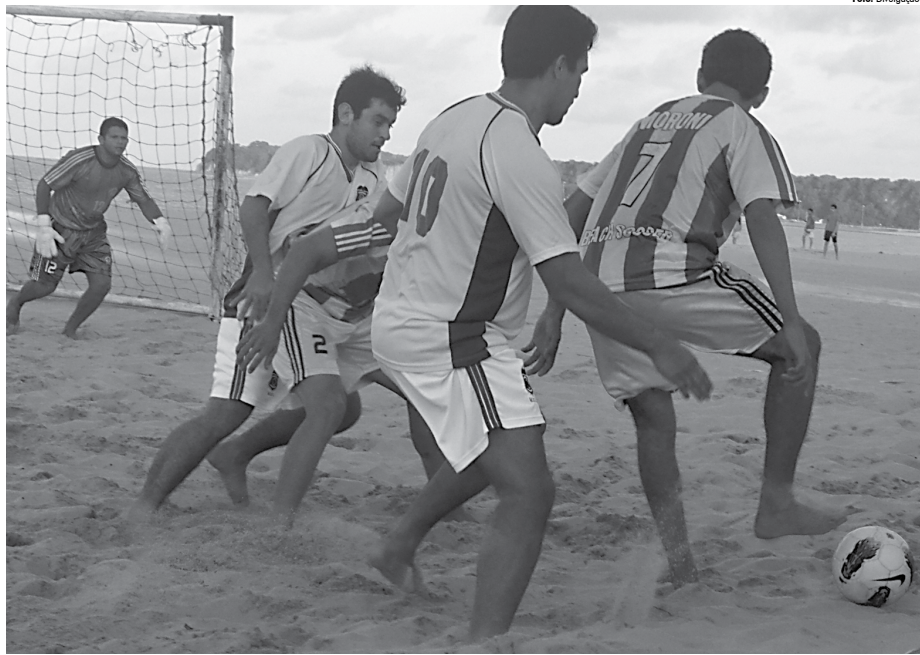
Competições que começam a partir de hoje no Litoral Norte serão disputadas neste sábado em Jacaraú. Mais de 300 atletas vão competir em diversas categorias de beach soccer.

A Copa Verão masculino adulto e a Copa Craques do Futuro nas três categorias são promovidas pela Federação Paraibana de Beach Soccer com o apoio da Confederação Brasileira de Beach Soccer, e da Secretaria de Esporte da cidade de Jacaraú. Os jogos começam a partir das 6h30.