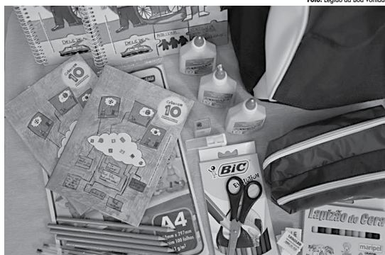
Material escolar beneficiando crianças e adolescentes de 66 centros comunitários e de cinco escolas da Paraíba

A ANS informou ainda, que em paralelo à suspensão de comercialização dos planos das sete operadoras em questão, dez outras operadoras poderão voltar a comercializar 46 produtos que estavam impedidos de vender, em função da comprovada melhoria no atendimento aos beneficiários.