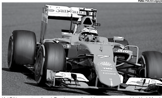
Kimi Raikkonen mostrou a força da Ferrari que segue fazendo bons tempos e marcando o império da Mercedes.

Os testes continuaram na parte da tarde, quando Lewis Hamilton assumiu o cockpit da Mercedes. A primeira etapa da temporada será na Austrália, em Melbourne, dia 26 de março.